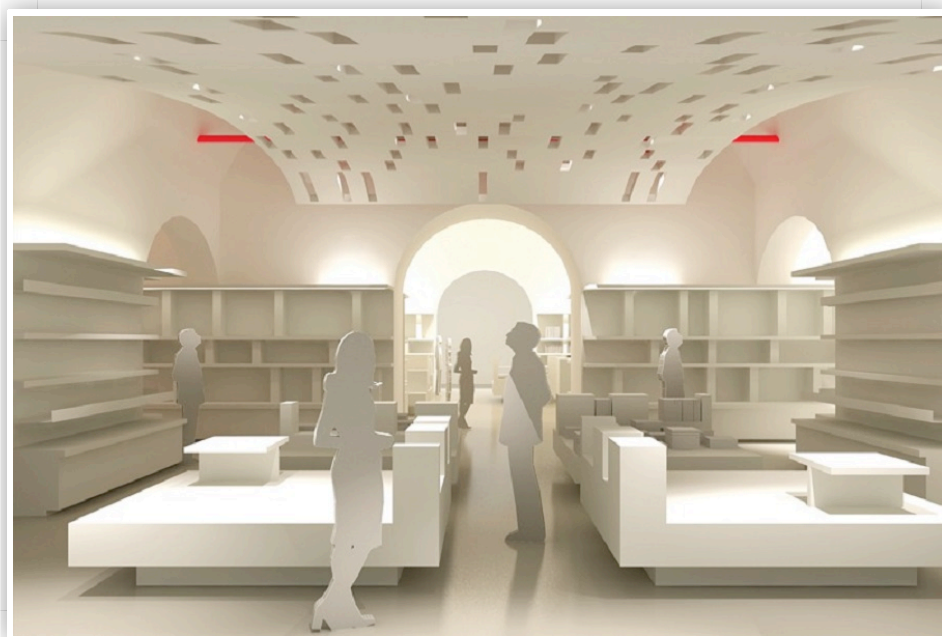
Roma, Bookabar - Libreria Palazzo delle Esposizioni

Promuove giovani talenti creativi under 35 con un progetto sui temi cari all'architetto morto nel 2012